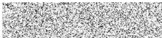
AVE CZ odpadové hospodářství s.r.o.: Ředitel provozovny Plzeň